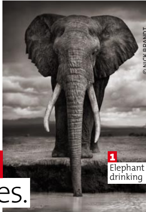
1 Elephant drinking