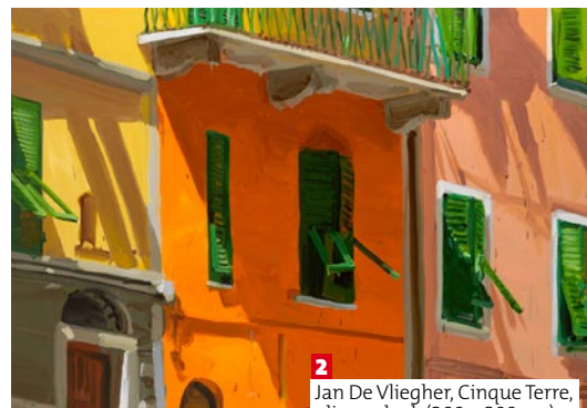
2 Jan De Vliegheer, Cinque Terre, olie op doek (200 x 300 cm).

1. Young Gallery. “De bedoeling van onze galerij is het grote publiek te sensibiliseren voor fotografie als kunstvorm”, zegt Pascal Young. “Daarom zoeken we over de hele wereld naar topfotografen die technische knowhow koppelen aan creativiteit.”