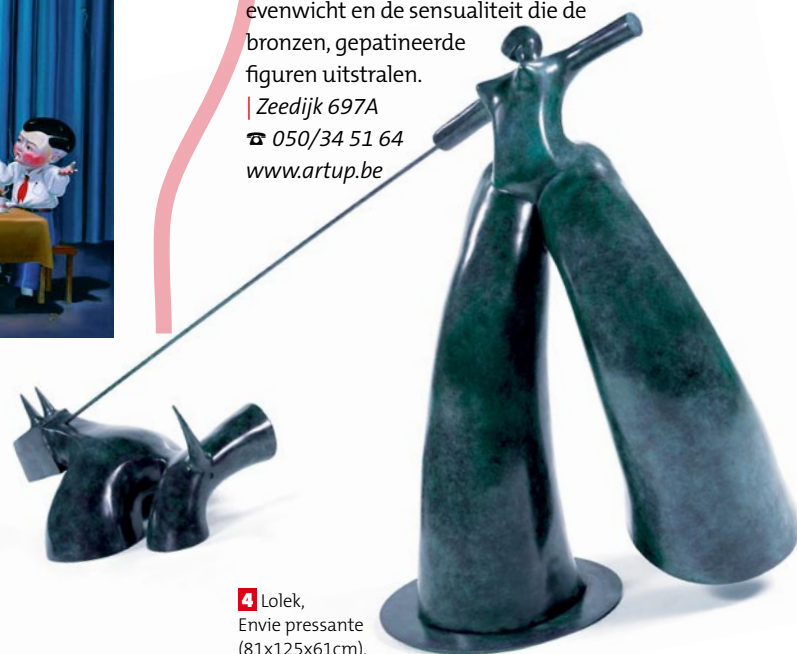
4 Lolek, Envie pressante (81x125x61cm).

| Kustlaan 229 en Zeedijk 757A - ☎ 050/31 77 87 en 050/60 18 36 www.robinsons.be