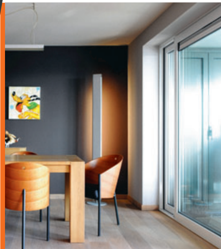
Door de grote terrasramen stroomt het licht naar binnen.