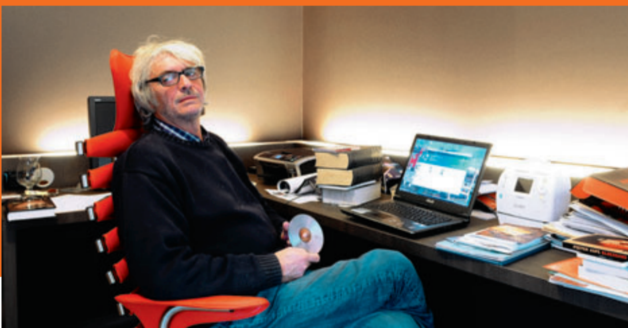
Pieter Aspe in zijn werkkamer. «Hier schrijf ik trouw zes dagen op zeven, ..»

MENSEN RIJDEN UREN OM HIER TE KOMEN, WIJ KRIJGEN DAT VAKANTIEGEVOEL ZO CADEAU