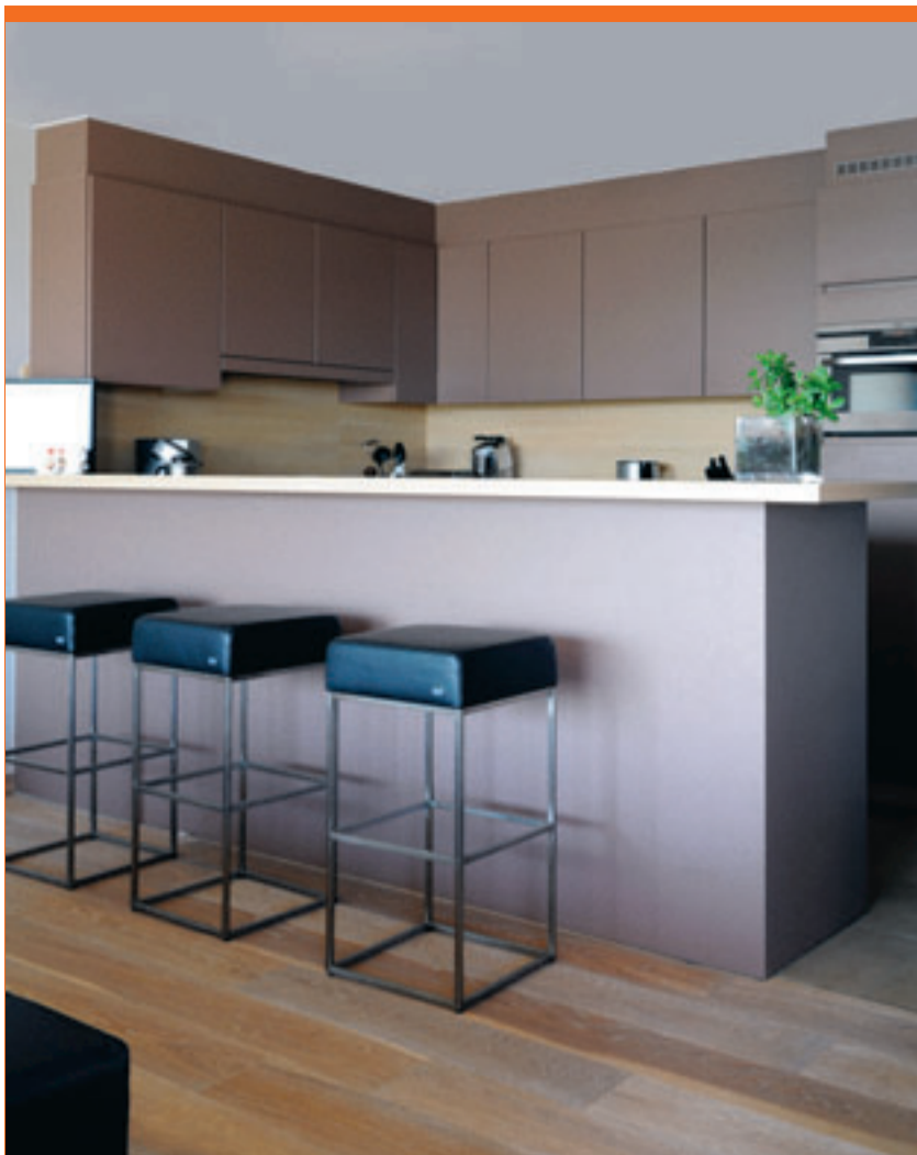
De open keuken wordt door een ontbijttoeg afgescheiden van de woonkamer.

De openheid van de jachthaven vind je ook in de woonkamer: keuken, salon en eetkamer vormen één geheel. Her en der staan er unieke figuren uit de strips van Kuifje. «Ik had nochtans gezworen geen verzameling meer te beginnen», zucht Aspe. «Ooit sprokkelde ik alles over de Heilig-Bloedkapel in Brugge. Ik was er jarenlang conservator van en woonde ook achter de kapel. Toen heb ik ondervonden