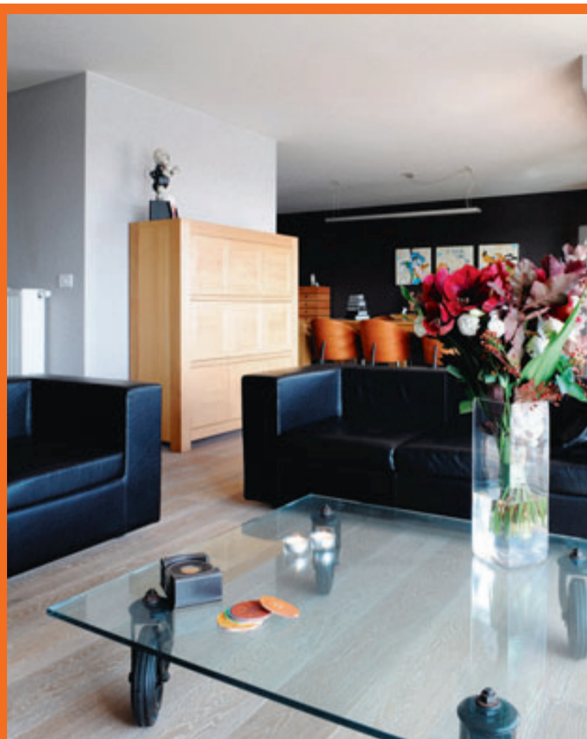
Het koppel koos voor een gedempt, eenvoudig kleurenpalet. «Zo heerst er altijd rust en harmonie in huis.»