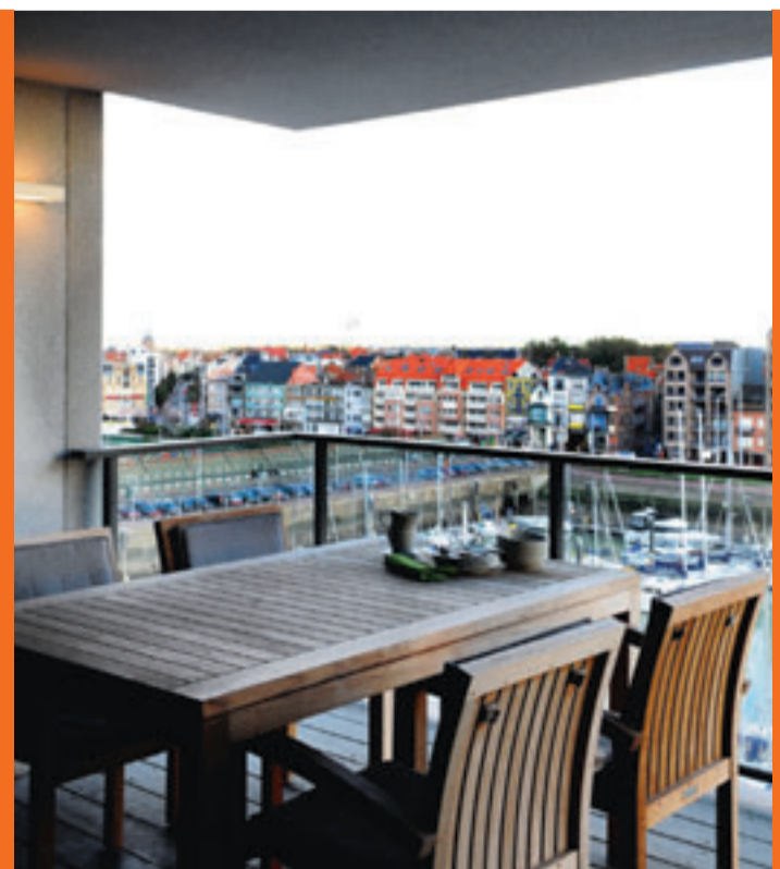
Het overdekte terras is een volwaardige buitenwoonkamer.